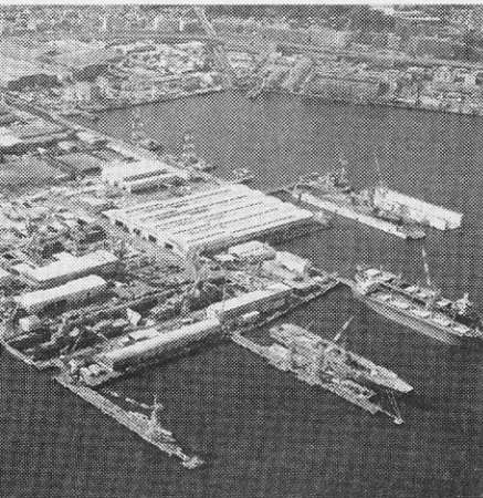
市は緑化条例で簡単に建物を増やさない（IHIMU横浜工場）

横浜市は09年4月に緑化地域制度を定め、事業所敷地面積の一定以上の緑化を義務付けた。IHIMUに限らず、横浜市